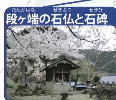
段ヶ端の石仏と石碑