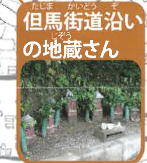
但馬街道沿いの 地蔵さん