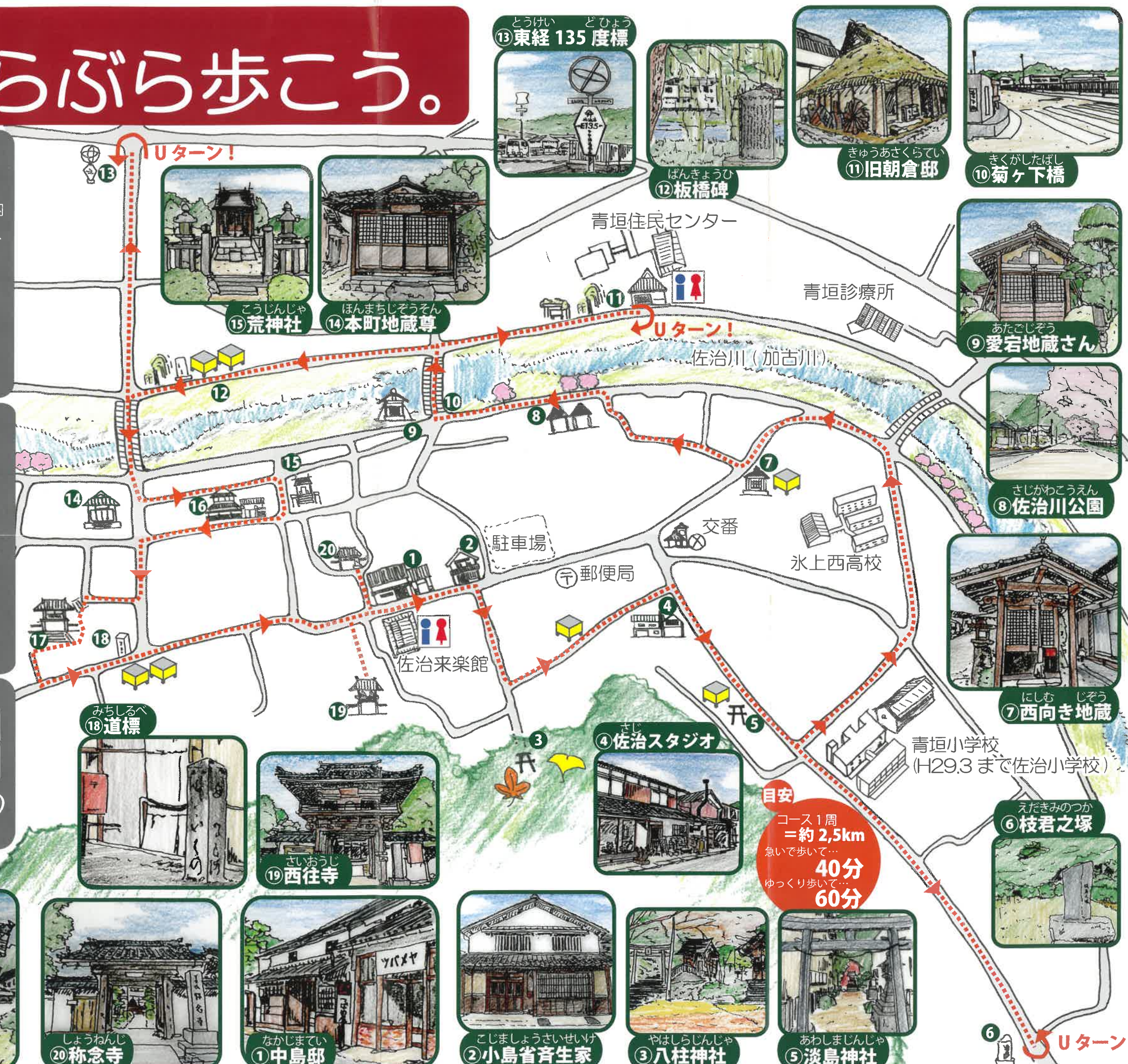
13 東経 135 度標